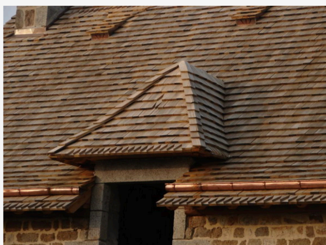
Tuiles en chêne