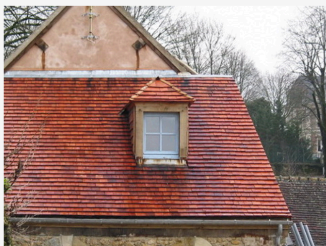
Tuiles en séquoia